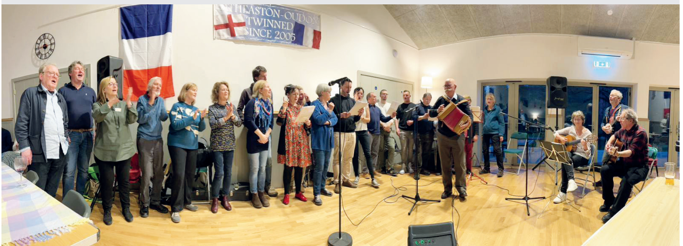
Soirée chant à Batheaston lors de la visite des Oudonnais.